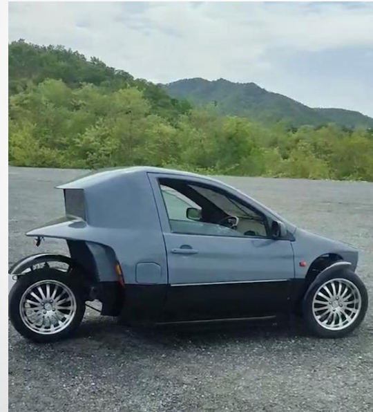
EV Station Thailand